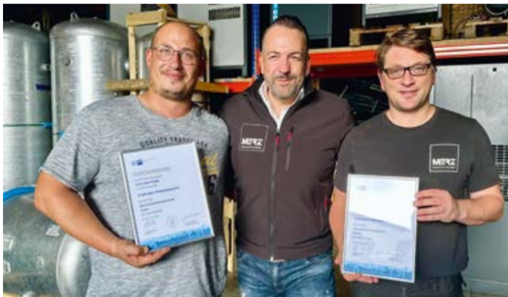
Ehrung zum Jubiläum langjähriger Kollegen

dig aufgebaut haben und pflegen, rundet unser Angebot weiter ab. Hier bin ich in der Vorbereitung von Daten z. B. bei der Preispflege tätig.