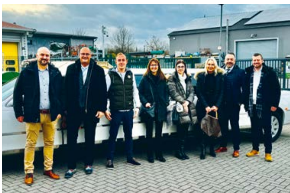
Betriebsausflug im kleinen Kreis