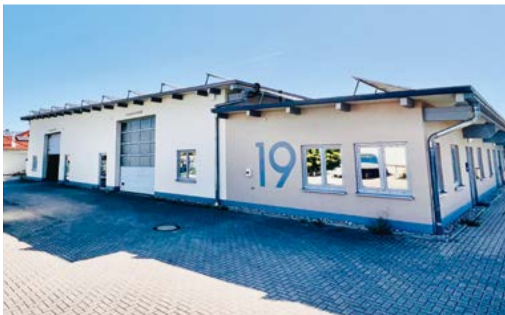
Betriebsgelände der Merz GmbH

Unseren Online-Shop, den wir selbststän-